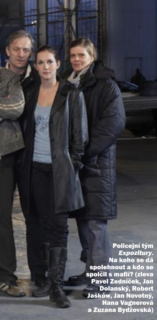
Policejní tým Expozitury. Na koho se dá spolehnout a kdo se spolčil s mafií? (zleva Pavel Zedníček, Jan Dolanský, Robert Jaškův, Jan Novotný, Hana Vagnerová a Zuzana Bydžovská)