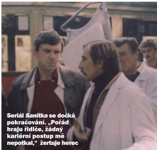
Seriál Sanitka se dočká pokračování. „Pořád hraju řidiče, žádný kariérní postup mě nepotkal,“ žertuje herec