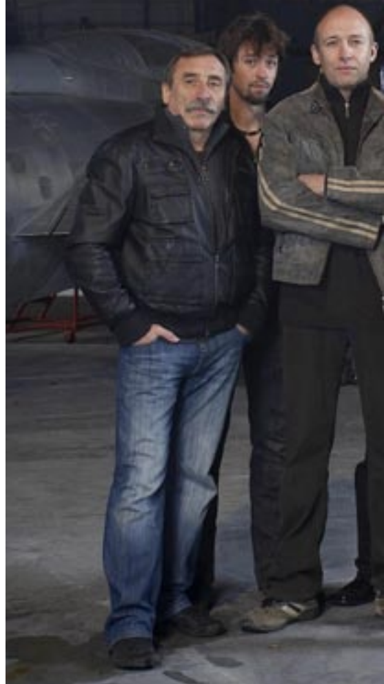
telefon s nabídkou. Také jste měl období, kdy jste čekal marně?

Byly takové časy, ale mě moc neznepokojovaly, protože jsem vedle filmu nebo televize měl vždycky divadlo. Nejhorší bylo, že za minulého režimu jste nikdy nevěděl, co to „ticho po pěšině“ může znamenat. Že máte od vedení televize nebo Barrandova dištanc, vám nikdo nikdy neřekl přímo do očí. Ta doba je našťastí pryč. Dneska si člověk připadá jako na houpačce: dlouho nic a pak se nabaluje jedna nabídka na druhou, až je musíte začít odmítat. Ale nestěžuju si.